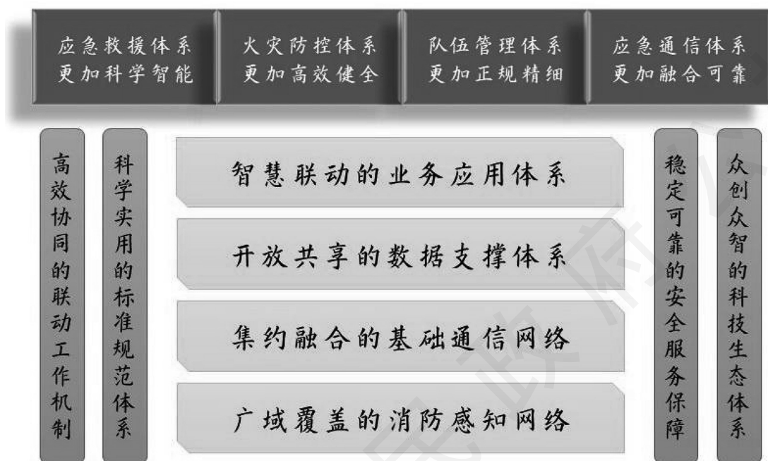
“数字消防”建设总体框架示意图

理精细化（详细任务见第七节“重大项目”项目六）。（责任单位和部门：各州、市人民政府；省消防救援总队，省发展改革委）